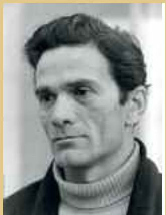
Pier Paolo Pasolini